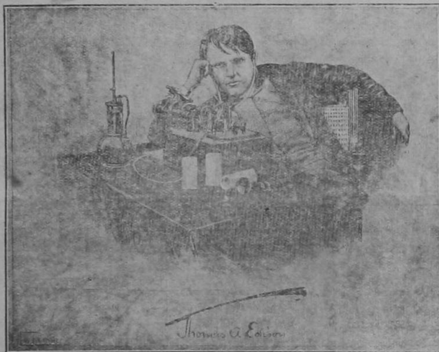
Fotografía de Edison en 1889

A las 3, 22 de la madrugada del domingo falleció a la edad de 84 años el famoso inventor americano Thomas A. Edison, en su residencia de Westorange.